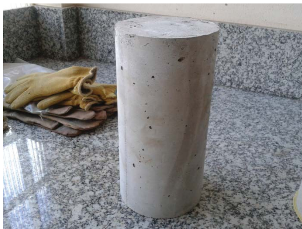
Figura. Probeta de ensayo cilíndrica (30cm x 15cm)

Las probetas deben ser cúbicas, cilíndricas o testigos que cumplan las especificaciones de las normas EN 12350-1, EN 12390-1, EN 12390-2, o EN 12504-1.