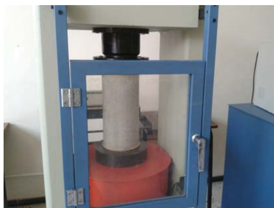
Figura. Máquina de ensayo a compresión

Máquina de ensayo a compresión, conforme a la norma EN 12390-4.