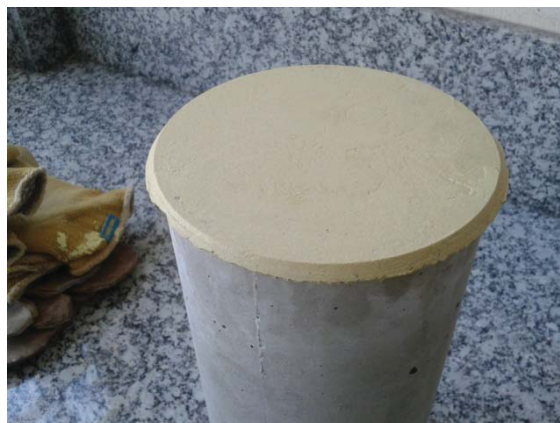
Figura. Probeta refrentada

El ensayo de compresión no debe efectuarse hasta que hayan transcurrido al menos 30 min desde la operación de refrentado.