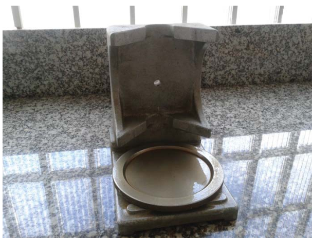
Figura. Equipo de refrentado

Se baja un extremo de la probeta, mantenida verticalmente, hasta apoyar en el plato horizontal que contenga la mezcla de azufre fundida. Se deja que la mezcla se endurezca antes de repetir el procedimiento con el otro extremo. Se utiliza un equipo de refrentado que asegure que las dos caras refrentadas estén paralelas y se utiliza aceite mineral como desmoldante de los platos (puede ser necesario recortar el material de refrentado sobrante de los bordes de la probeta)