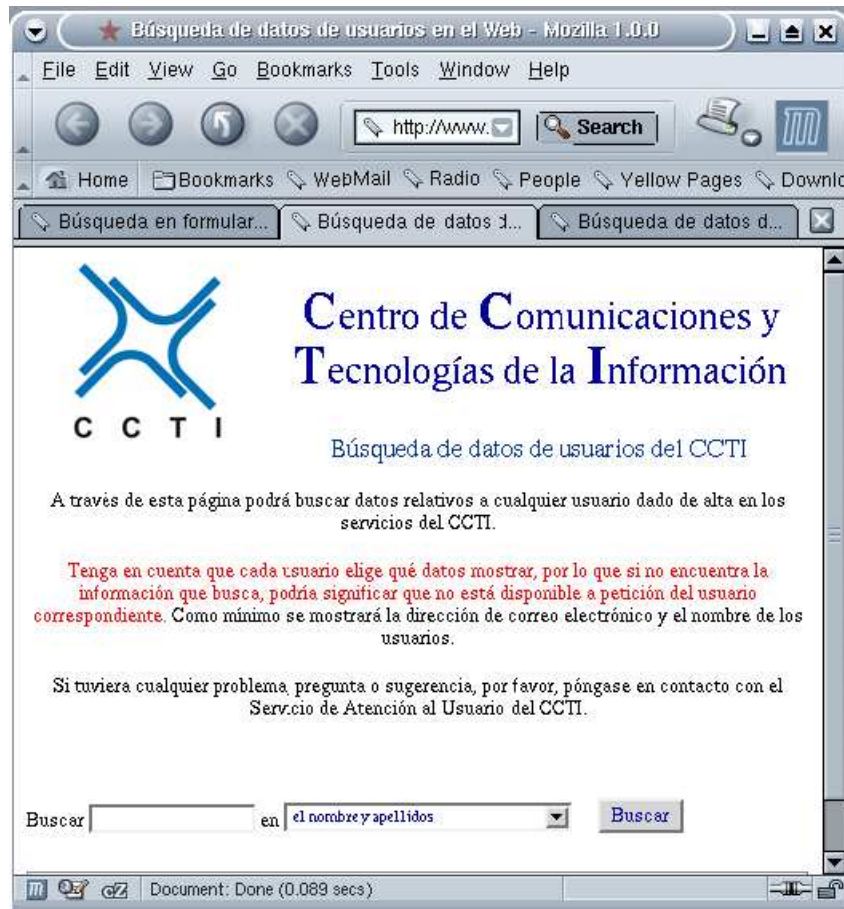
Figura 10.1: El buscador de personas de la ULL

En primer lugar, visite la página en la que esta ubicado: http://www.cti.ull.es/bd/ . La figura 10.1 muestra la interfaz que percibe un usuario humano.