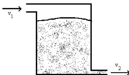
Figura 3.2. Problemas de mezclas.

Se mezclan dos soluciones de diferente concentración en un recipiente. Queremos conocer la cantidad de soluto presente en cada instante dentro del mismo.