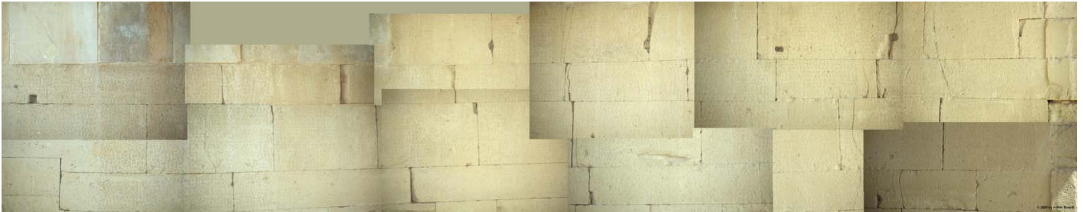
Foto-montaje de las Leyes de Gortina sobre la base de diapositivas de color producido y escaneado en 1992.